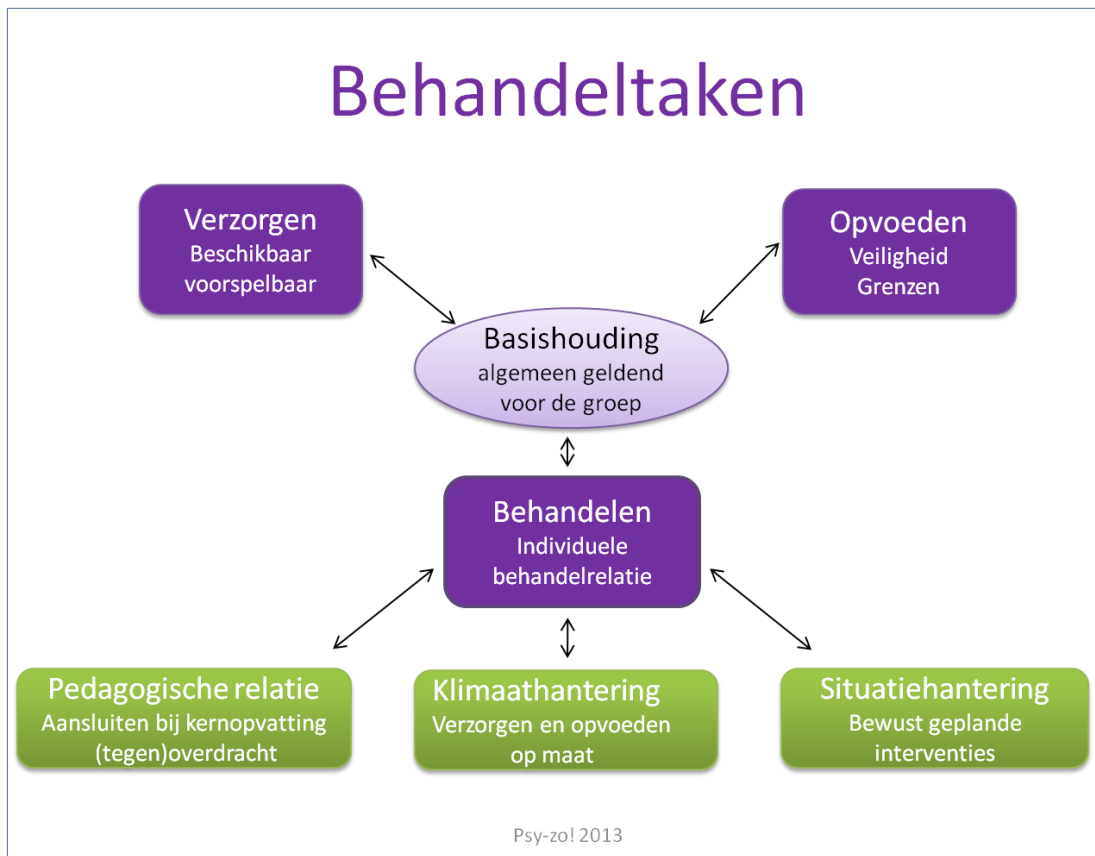
Figuur 1. Integratief behandelmodel (Van Rijn, 2011)

Kinderen en jongeren die uit huis geplaatst worden, zijn meestal getraumatiseerd. Als ze opgenomen zijn in een behandelinstelling is traumabehandeling dan ook een onderdeel van een breder behandelplan waar verschillende disciplines bij betrokken zijn. Voor het effect van de behandeling is het belangrijk dat de behandelplannen van deze disciplines op elkaar zijn afgestemd. Het lijkt een open deur maar dat dit een lastige taak is, blijkt wel uit de eilandjescultuur van disciplines die in veel instellingen bestaat. In een dergelijke cultuur werken de verschillende disciplines vanuit hun eigen invalshoek, maar komen ze niet tot eenzelfde behandelplan waarin men gericht volgens gezamenlijke afspraken werkt aan hetzelfde doel. De behandelplannen van de verschillende disciplines hebben dan geen onderlinge samenhang, waardoor er nauwelijks sprake kan zijn van efficiënte behandelplanning (Van der Harten & Van Rijn, 2008). Een integratieve behandeling staat of valt met een gezamenlijke visie op de diagnose en de behandeling: kan elke behandelaar zich vinden in de diagnose en geeft dit richtlijnen voor de behandeling? Vanuit deze interne consistentie kan er sprake zijn van een efficiënte behandelplanning en afstemming van de onderlinge plannen.