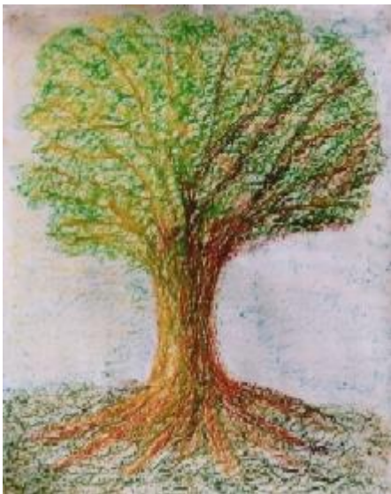
Figuur 3. De boommetafoer (van Rijn, 2011)

De gedragswetenschappers, groepsleiders, betrokken medische dienst en het management van de instelling waar Jesse verblijft, hebben allen een workshop gevolgd over Behandelend opvoeden (Van Rijn, 2011). Deze gaat uit van het integratief behandelmodel en is gericht op (begeleiding bij) de drie behandeltaken van de groepsleiders zoals hierboven beschreven. In de workshop staat de vormgeving van de behandelrelatie centraal. Belangrijk hierbij is dat de groepsleider aansluit bij de psychopathologie. Daarbij zijn niet de gedragskenmerken leidend maar wel de kernopvatting van het kind of de jongere. Dit geeft aan het team groepsleiders een kader waarmee het denken, voelen en doen van de jongeren begrepen kan worden. In interactie met de jongere wordt hiermee rekening gehouden. Dat wil zeggen dat bij het plegen van interventies – bewust in trainingen of onbewust in spontane interacties - aangesloten wordt bij die kernopvatting. De essentie hiervan wordt weergegeven in de metafoer van een boom, zie figuur 3.